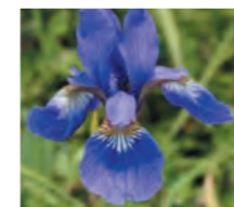
アヤメ 網目のような模様が入る