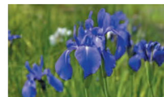
カキツバタ 白い筋が入る