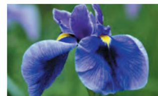
ショウブ 黄色い筋が入る